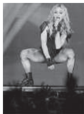
Выступление Мадонны в Пирене

Для лучшего понимания обычаев горожан необходимо помнить, что 8 лет назад в культурной жизни страны произошла пирестройка. Старые скульптурные памятники, в основном разрушены, сохранены только фрагменты, изображающие п — пимятники.