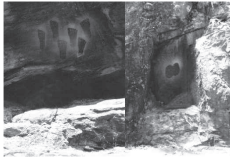
Пещеры викингов Снежные горы, Австралия

принадлежат не аборигенам, а представителям европейской расы.