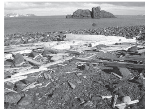
Остатки разбившегося корабля викингов Остров Короля Георга, Антарктида

дружина разделилась, одна часть осталась на материке и постепенно слилась с местным населением, а другая отправилась дальше на юг, добралась до Антарктиды и нашла конец уже на другой стороне ледяного континента.